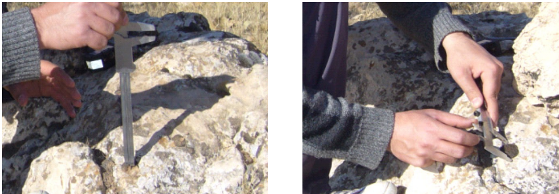
شکل ۲. اندازه‌گیری حداکثر طول، حداکثر عرض (سمت راست) و حداکثر ضخامت خزه‌ها (سمت چپ) با دستگاه کولیس