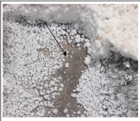
شکل ۴. شکل‌گیری دره نمکی در گنبد نمکی کرسیا