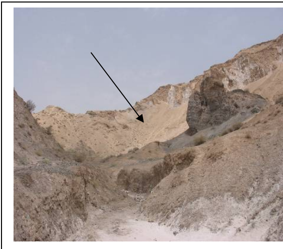
شکل ۵. اشکال گل کلمی در کنار چشمه‌های نمکی