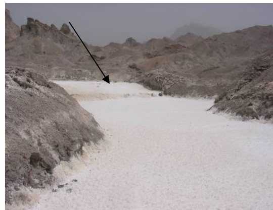
شکل ۲. چشمه نمکی در پای گنبد نمکی کرسیا