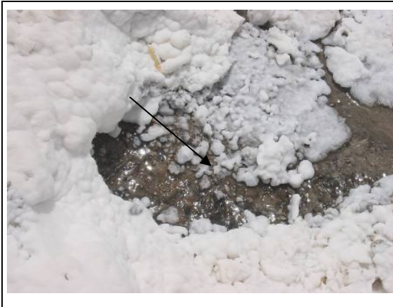
شکل ۳. رودخانه نمکی در پایین دست گنبد نمکی کرسیا