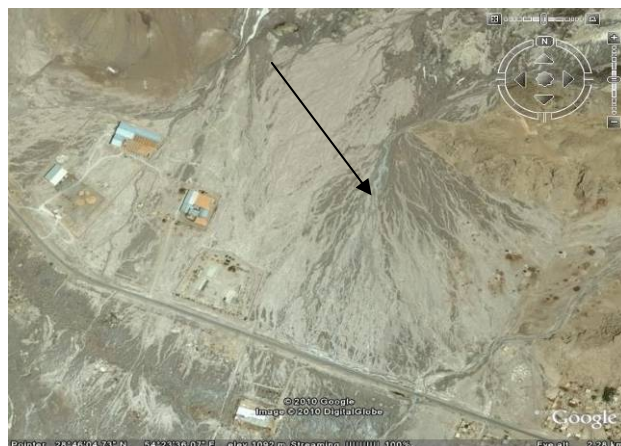
شکل ۶. مخروط نمکی که در پای گنبد نمکی کرسیا شکل گرفته است