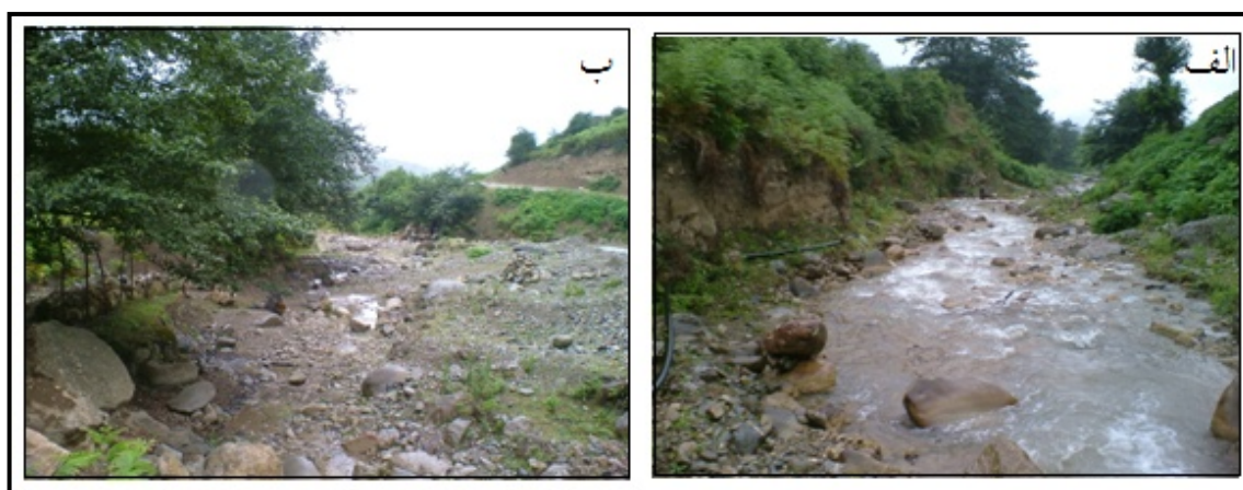
شکل ۳: تصاویر بازه ۲، الف) بستر رودخانه در مجاورت تراس آبرفتی قدیمی (ب) کانال سیلابی و مانع میان کانالی بازه ۳ : این بازه در موقعیت محدود با دره‌ای تنگ و عمیق که عرض آن از ۵ تا ۲۰ متر متغیر است قرار گرفته و بیش از ۹۰ درصد آن به دیواره دامنه اتصال داشته و شکل گلوگاه می‌باشد (شکل ۴ الف). الگوی رود به صورت تک کانالی بوده و مسیر رود تابع پیچ و خم دره است. متوسط شیب دره 0/04 متر بر متر است. اشکال بستری غالب در کانال سکو-تالاب‌های متوالی بوده و در قسمت‌های محدب کانال به صورت محلی، از رسوبات انباشته شده (شکل ۴ ب) و گیاهان بر روی آن‌ها استقرار یافته‌اند. این بازه به علت قرارگیری در یک دره عمیق و باریک و همچنین وجود دیواره‌های سنگی