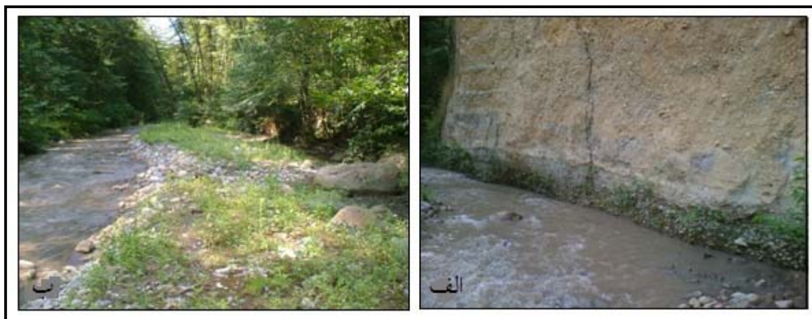
شکل ۶: تصاویر بازه ۵، الف) تراس آبرفتی قدیمی در کرانه رود ب) بستر رود و دشت سیلابی مجاور رود