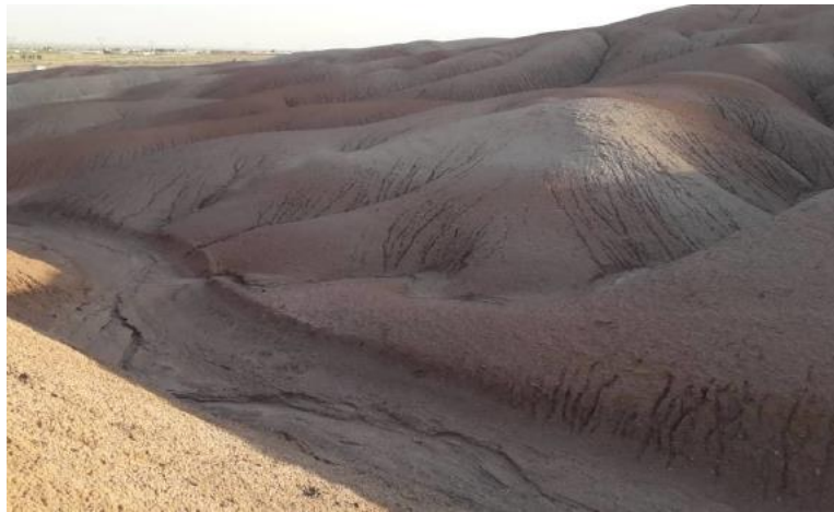
شکل ۴: سازند قرمز بالایی در منطقه مطالعاتی