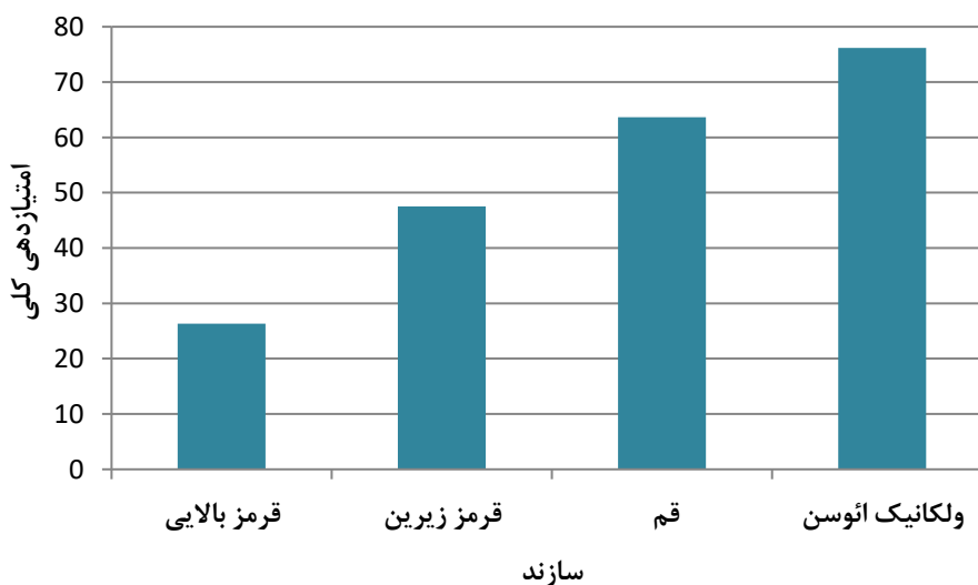
شکل ۷: امتیازدهی کلی