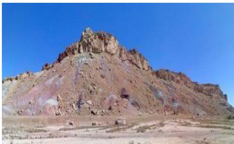
شکل ۳: سازند قرمز زرین در منطقه مطالعاتی