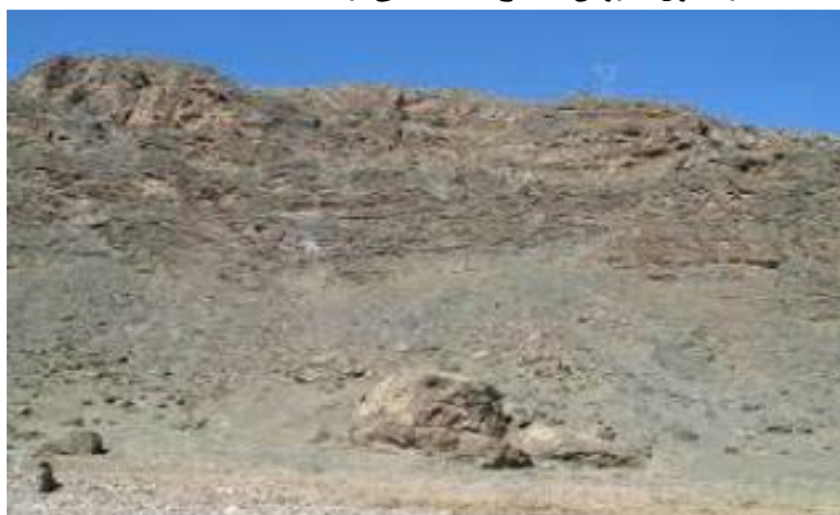
شکل ۲: سازند قم در منطقه مطالعاتی

مقایسه می‌شود سپس میزان تغییر رنگ تعیین شده بررسی می‌شود (دهداری فر و همکاران، ۱۳۹۹، ۵۹۸). به منظور اندازه‌گیری فواصل درزه از خط‌کش استفاده شد و فاصله بین دو درزه متوالی برآورد گردید. عرض درزه‌ها نیز با استفاده از خط‌کش تعیین گردید. براساس این که درزه‌ها جهت‌یافته‌اند یا خیر و شیب آن‌ها نسبت به شیب دامنه به چه صورت می‌باشد، امتیازدهی داده شد. پیوستگی درزه‌ها با بررسی امتداد درزه‌ها و مقدار پرشدگی مشخص و بر این اساس امتیازدهی شد. هم‌چنین وضعیت پوشش گیاهی بر روی دامنه سازندی براساس انبوه پوشش گیاهی در ۱۰۰ متر مربع دسته‌بندی شد و نمونه‌برداری به روش تصادفی سیستماتیک انجام شد. از آنجایی که فاکتور پوشش گیاهی به سبب نقش مثبت در مقاومت سازندها از اهمیت بسزایی برخوردار است لذا ۵-۰ بوته در ۱۰۰ متر مربع در طبقه خیلی حساس، ۱۰-۵ بوته در ۱۰۰ متر مربع در طبقه حساس، ۱۵-۱۰ بوته در ۱۰۰ متر مربع در طبقه متوسط، ۲۰-۱۵ بوته در ۱۰۰ متر مربع در طبقه نسبتاً مقاوم و ۲۵-۲۰ بوته در ۱۰۰ متر مربع در طبقه مقاوم قرار گرفته شد. تحلیل نتایج نیز به کمک آنالیز واریانس و آزمون مقایسه میانگین‌های چند دامنه‌ای دانکن و استنباط آماری نتایج انجام گرفت. در نهایت نیز تحلیل نتایج و مقایسه وضعیت تخریب‌پذیری واحدهای سازندی و انطباق نتایج با شواهد ژئومورفولوژی دامنه‌ها صورت گرفت و فاکتور پوشش گیاهی به عوامل مدل سلبی اضافه شد. در جدول ۱، روش اصلاح یافته سلبی ارائه شده است.