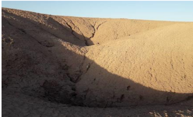
شکل ۵: سازند قرمز بالایی هوازده در منطقه مطالعاتی