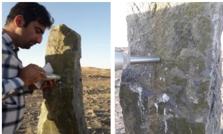
شکل ۶: تصاویری از نحوه نمونه برداری