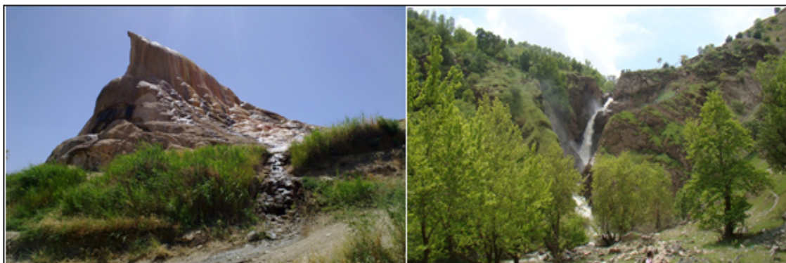
شکل ۲: نمایی از ژئوسایت‌های محدوده مطالعاتی آبشار شلماش و چشمه معدنی گراوان

بر اثر تنوع اقلیم مختلف و نوع خاک، بعضی از نواحی ایران را جنگل‌هایی انبوه فراگرفته است (ثابتی، ۱۳۴۶: ۱۰۳). ژئومورفوسایت جنگلی زاب یکی از این نمونه‌ها است که در ادامه جنگل‌های زاگرسی واقع بوده و نوع غالب آن‌ها بلوط است. محدوده موردنظر در حدفاصل شهرهای سردشت و پیرانشهر واقع است و نزدیک‌ترین کانون زیستی به آن شهر جدید میرآباد است. بخشی از این سایت بر اساس مصوبه سازمان حفاظت محیط‌زیست از سال ۱۳۸۰ تحت حفاظت قرار گرفته است. مورفولوژی کلی این سایت جنگلی - کوهستانی می‌باشد که رودخانه زاب از وسط آن می‌گذرد. جوامع درختی دیگر مربوط به پوشش زاگرسی همچون بنه، زالزالک و بادام خودرو و ... نیز در سطح این سایت پراکندگی دارند. از قابلیت‌های این سایت می‌توان به تراکم و تنوع پوشش درختی، نزدیکی به کانون‌های شهری و نیز مناظر جذاب و آب‌وهوای مطلوب و گذر رودخانه زاب از میان آن و اشکال زیبای رودخانه‌ای همچون مائندهای زیبا و نیز وجود آثاری تاریخی همچون پل قلاتاسیان در محدوده به همراه وسعت زیاد سایت اشاره کرد.