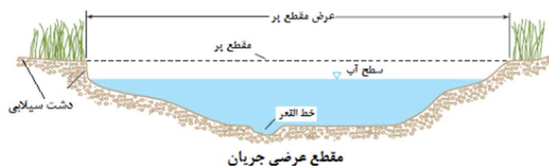
شکل ۲: نمایی از اندازه گیری دبی لبالبی (Lawlor, 2004)

با توجه به آثار کناره رودخانه از جمله زیربری رودخانه، تغییرات جنس در کرانه رودخانه، آثار خزه ها و گل‌سنگ ها، تغییرات رنگ سنگ ها و همچنین سطح دشت سیلابی (در صورت وجود دشت سیلابی) مقطع دبی لبالبی مشخص و عرض و عمق دبی لبالبی با استفاده از متر و شاخص اندازه گیری شد (شکل ۲). برای مشخص نمودن متوسط عمق با استفاده از شاخص نقشه برداری در نقاط مختلف از تراز دبی لبالبی (عرض مقطع پر)، عمق اندازه گیری شده و میانگین عمق‌های هر مقطع به عنوان عمق متوسط در نظر گرفته شده است.